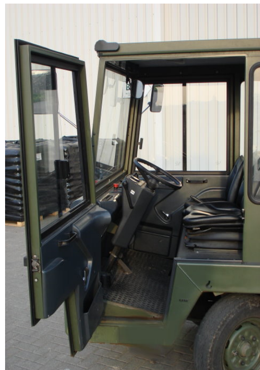
Weit ausladende Einstiegstüren mit Schiebefenster ( Option )