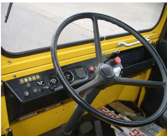
Übersichtliche Anordnung aller Armaturen im Blickfeld des Fahrers.