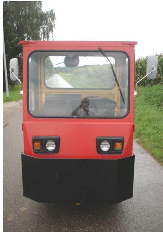
Große Windschutzscheibe für gute Rundumsicht mit Front – und Heckscheibenwischer