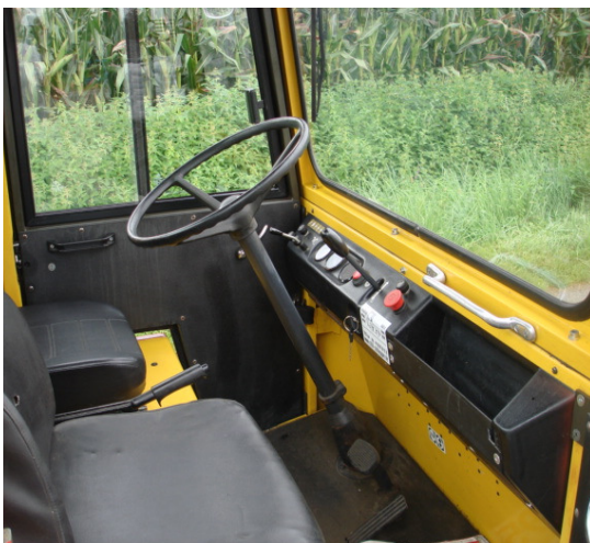
geräumiger Fahrgastraum mit 2 Sitzplätzen