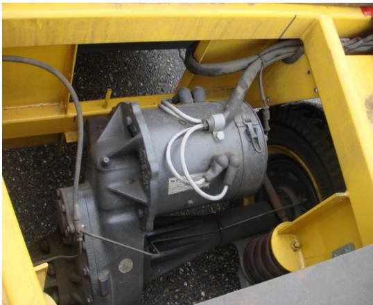
kraftvoller 4,5 KW Elektromotor