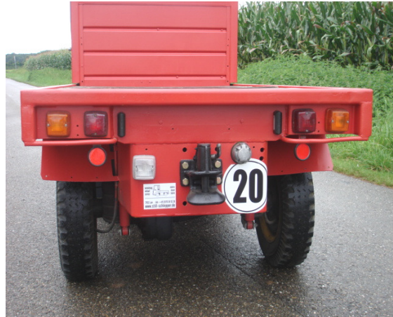
12 V - Lichtanlage nach StVZO Vorschriften