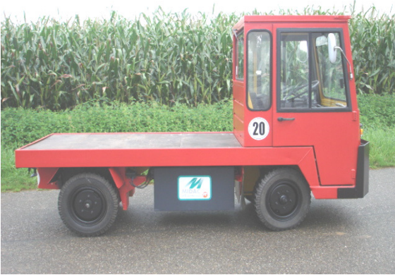
Ebene Ladefläche 2210 mm lang Ladehöhe 800 mm