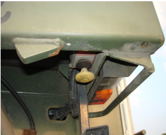
Praktische Rücktasteinrichtung beim Ankuppeln von Anhängern ( Option )