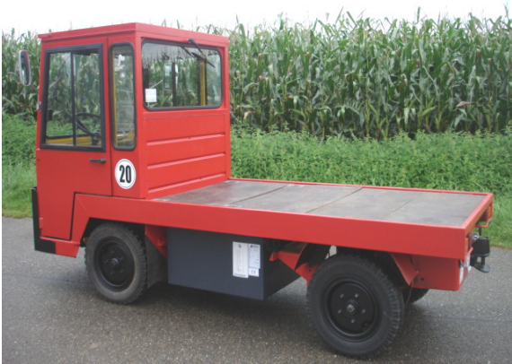
Gute Rundumsicht nach hinten durch große Glasflächen und hohe Sitzhöhe.