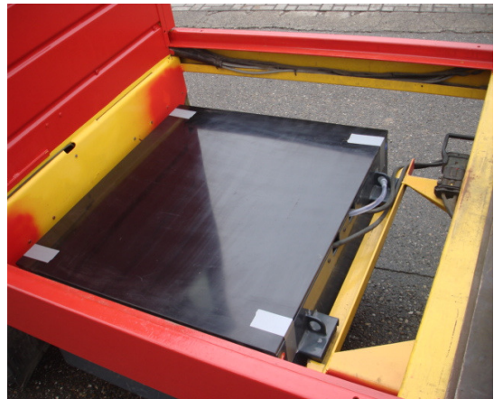
Gut zugängliche Batterie